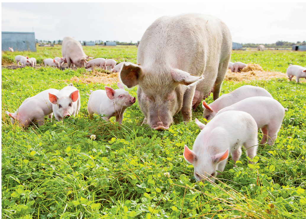
Friland fejrer deres 25-årsjubilæum med en middag for leverandører og bestyrelsesmedlemmer i forbindelse med årsmødet d. 22. november.