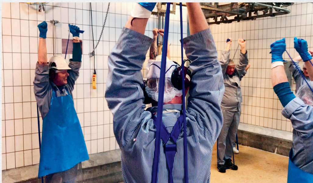
Elastikøvelserne er et pilotprojekt. Først samles der erfaringer fra Skærbæk, og herefter skal der kigges på, om det skal ud på alle fabrikker.

- Jeg kan godt mærke, at jeg har været i gang i mange år. Jeg er blevet lidt mere slidt.